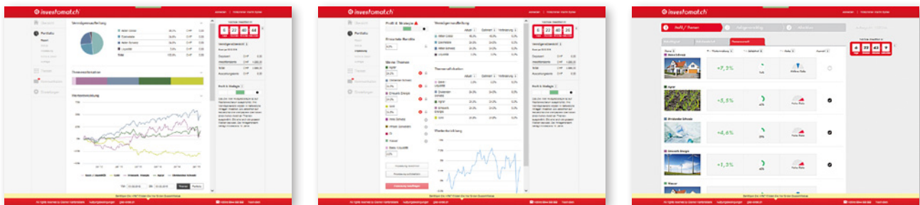
Der Investomat führt übersichtlich durch den Prozess

Der Kunde kann jederzeit erwartete Rendite und erwartetes Risiko des Portfolios einsehen. Automatische Monitoring-Regeln ermöglichen die permanente Überwachung der Portfoliowerte. Mittels automatisiertem oder manuellem Rebalancing kann das Portfolio laufend auf die optimale individuelle Strategie angepasst werden. Die Kommunikation zwischen Bank und Kunde erfolgt über die im Investomat-Cockpit integrierte Messaginglösung der additiv DFS.